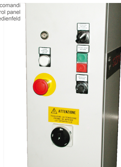
Quadro comandi Control panel Bedienfeld